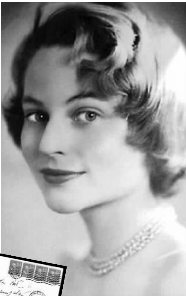
肯尼迪的瑞典情人波斯特