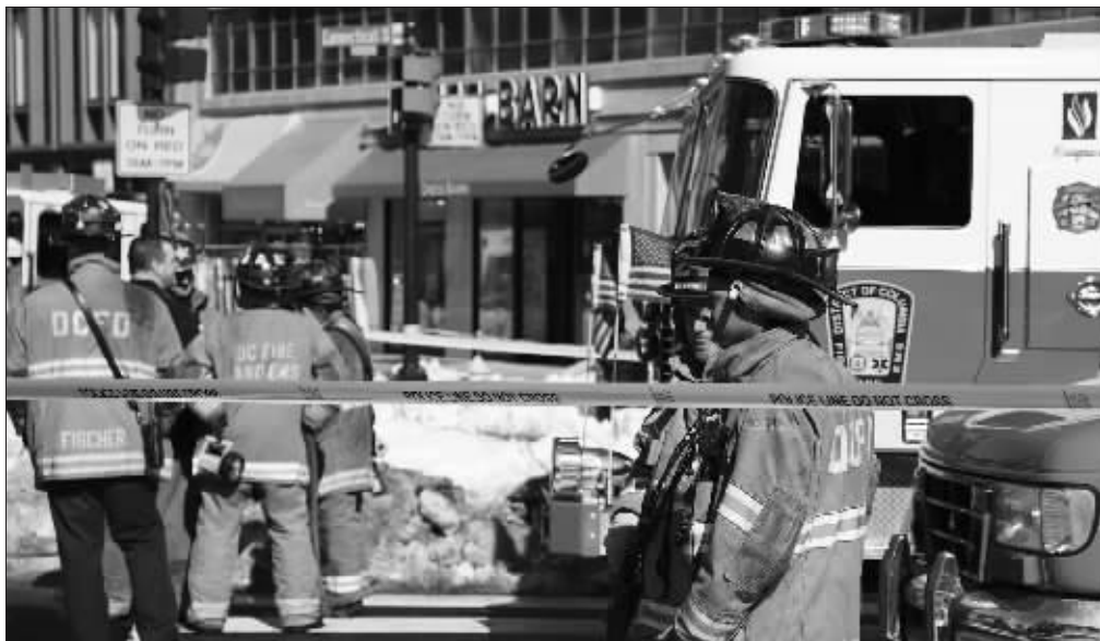
12日,华盛顿,消防员站在发生地铁列车出轨事故的地铁站外