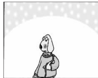
出生后脖子上就有了一根绳索。