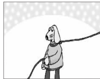
常常幻想自己也能掌握一根绳索,体验操纵着别人的感觉。