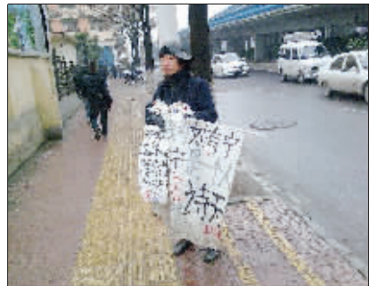
狂人 近日在大桥南路附近看到一个狂人,快过年了,他回家吗? (作者将获30元话费)