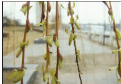
我要发芽 寒风凛冽,河岸一排排柳树居然冒出了嫩嫩的芽儿。绿化工作人员说,提早发芽主要是因为日照充足,湿度适宜。 (作者将获30元话费)