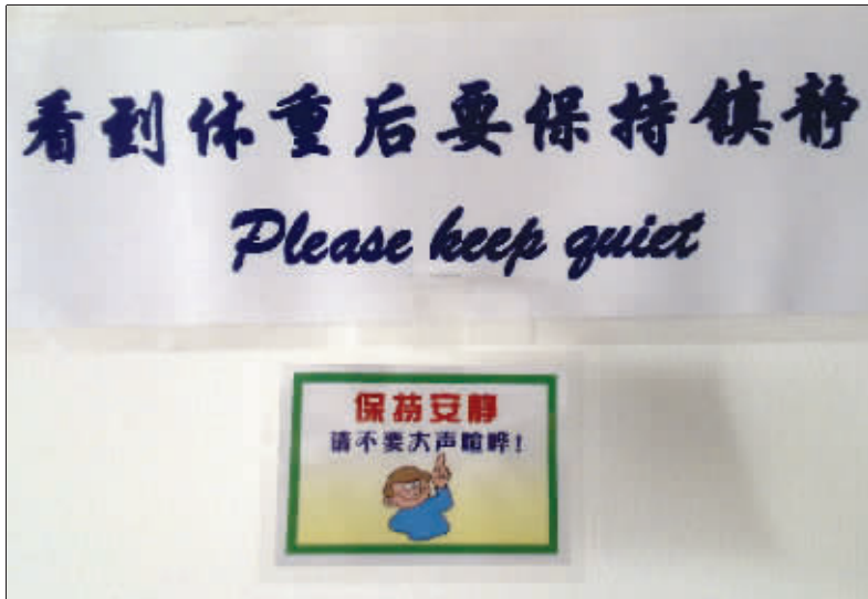
昨天,在一家健身减肥中心看到一个标语很搞笑:看到体重后请保持镇静。(作者将获30元话费)