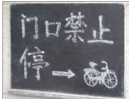
图文并茂 南京博物院入口,一块小黑板上图文并茂,告诉大家门口禁止停放自行车。 (作者将获30元话费)