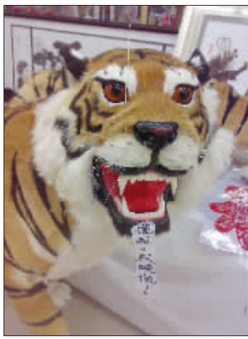
虎威 虎年来了,商场里这只“老虎”虎威十足:摸我,我咬你! (作者将获30元话费)