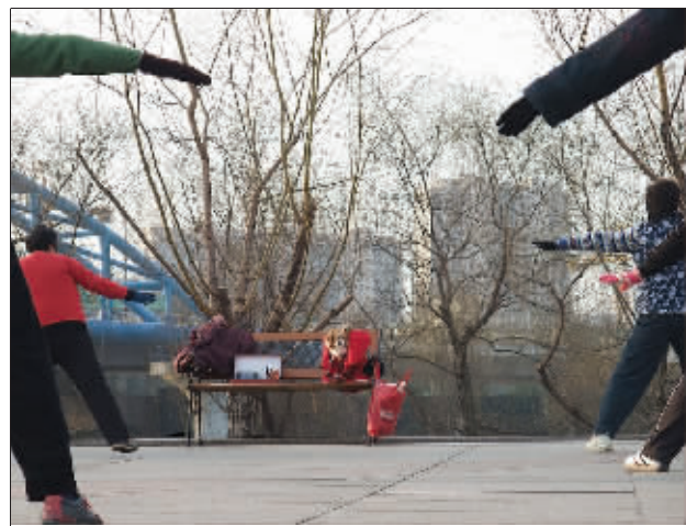
你们跳,我看着 红衣小狗坐在教练宝座上,正认真地观看大家跳舞呢!人模狗样的,谁跳得不好,它会冲谁叫哦! (作者将获30元话费)