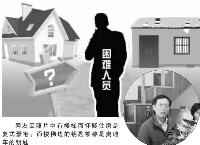
网友因照片中有楼梯而怀疑住房是复式豪宅；而楼梯边的钥匙被称是奥迪车的钥匙

“他的住房如果是平房呢？很可能还是老式的尖顶平房，把尖顶部分装修成储物间阁楼也是可以的；他的住房如果是租或借住的呢？对上有老、下有小的上海中年人来说，如果至今还没有属于自己的住房，那他的生活压力很大；至于照片上的钥匙，很可能是助力车钥匙，因为有些助力车钥匙也像这样。况且，如果他的职业就是驾驶员，又如何呢？”