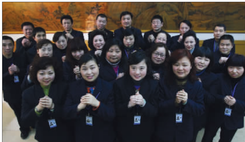
山西路百货大楼经营团队向全体市民拜年

春节临近,也意味着最浪漫的情人节的到来,从本周开始,山百大楼将提前推出双节生辉第一场“爱情、友情、骨肉情,有礼、好礼、感恩礼”情人节特别企划,周大福还将有独家巨献,同时,还开展年末大酬宾,全场1-5折起热卖大酬宾活动。