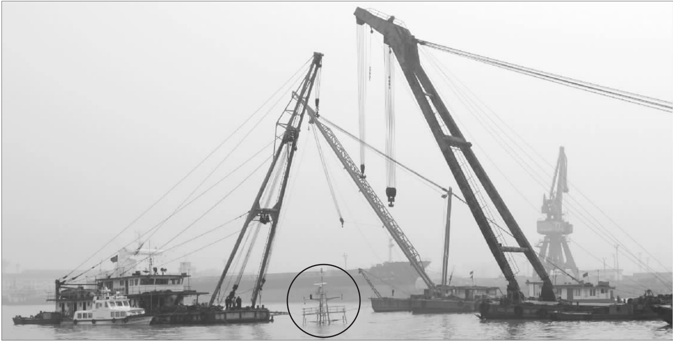
打捞搜救现场,可见露出水面的沉船桅杆(画圈处)