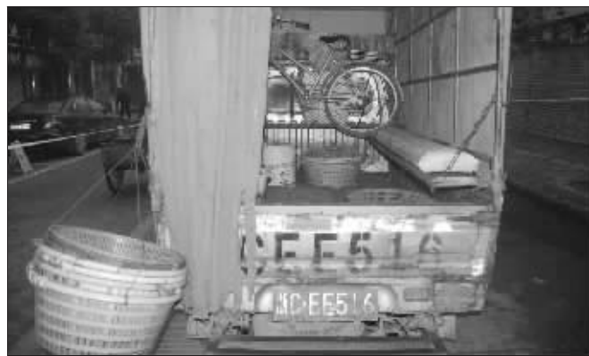
警方与歹徒搏斗的现场

警方分析认为:当时虽是凌晨时分,但事发地是闹市区,加上车厢空间狭小,为了人质安全,不能轻易开枪;由于事发突然,增援力量尚未到位,而眼前情况又紧急,稳定歹徒情绪很重要。适当的“妥协”,人质更加安全;群众报警时称,这名“挥刀男”可能“精神有点问题”。民警在接触中,也发现对方情绪有些失控,一些常规“套路”并不见效,所以采取了上述措施;在同时放下武器瞬间,凶器远离人