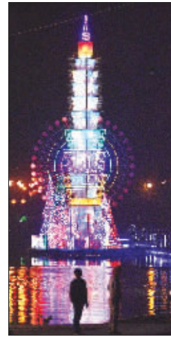
台北101大楼造型的彩灯