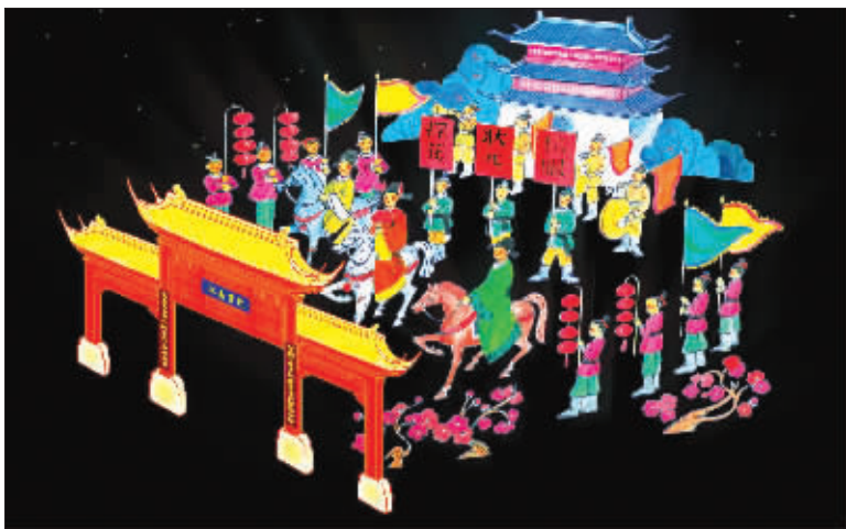
状元巡游灯组

在台湾嘉义新春灯会上展示的6组秦淮花灯,一直倍受关注!昨天,秦淮区政府工作人员首次向媒体披露了它们的“真容”。据悉,最能体现秦淮花灯传统特色的荷花灯组,将摆放在台湾嘉义灯会秦淮花灯展区主入口处,高达10米,比3层楼房还高,十分抢眼。