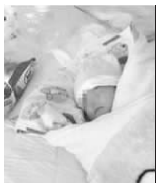
被家长放弃的宝宝

近日,天涯论坛一个网帖称,天津一名刚出生患肛闭等疾病的宝宝,父亲及亲人对她放弃治疗并送到临终关怀医院,志愿者上门救助,父亲及亲人坚持不予治疗。整个过程在网上直播,引起网友极大关注,并展开应否救治的大激辩。