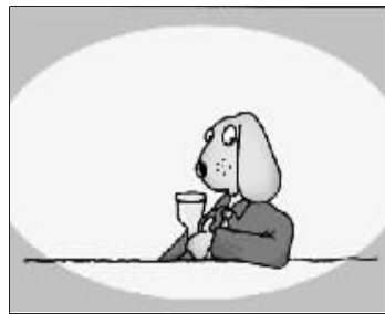
有了美酒就想拥有美女