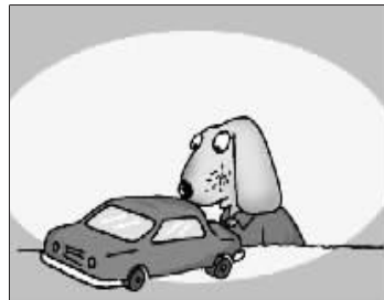
有了房产就奢望汽车