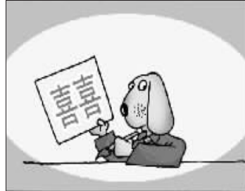
有了爱情就渴望婚姻