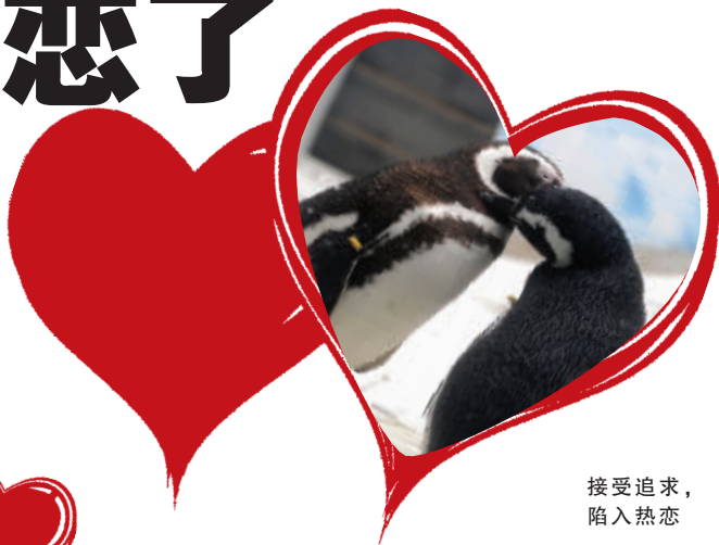
接受追求, 陷入热恋

快到情人节了,红山动物园里的六只麦哲伦企鹅也想凑个热闹,赶在节前开始恋爱。有趣的是,企鹅小伙讨好女孩子也得花费一番心思,跳舞、亲吻、送礼物……各有各的妙招。