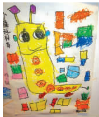
《小鹿玩具车》杨一鸣 4岁 百家湖清华幼儿园 指导老师:白宗巧