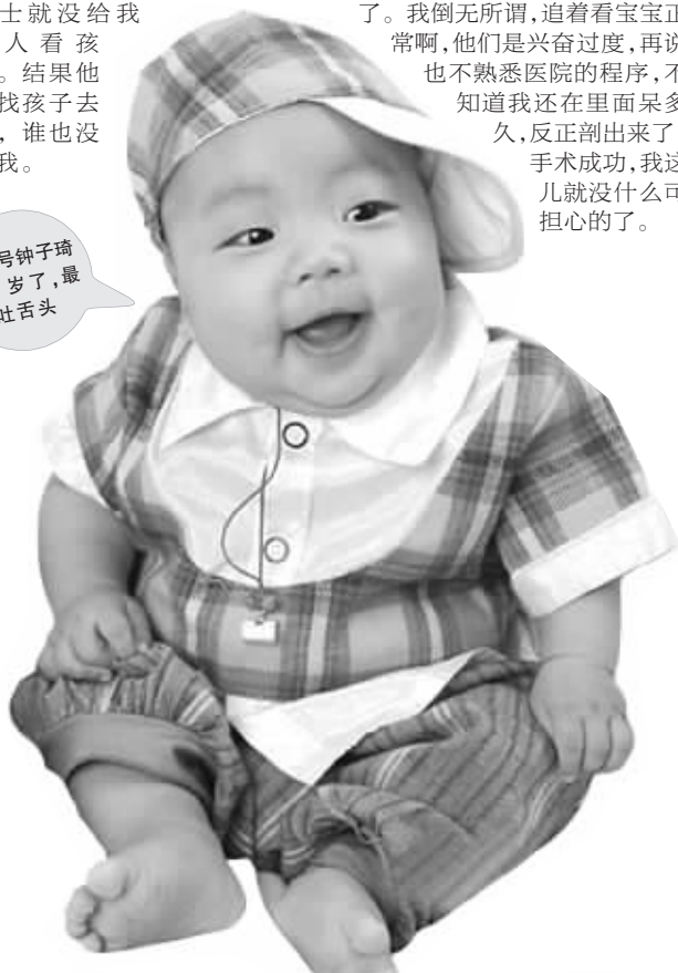
816号钟子琦 1岁了,最爱吐舌头

caiwenw: 我一出来,我LG和我婆婆就围着我问,孩子呢?孩子呢?原来医生护士就没给我家人看孩子。结果他们找孩子去了,谁也没管我。