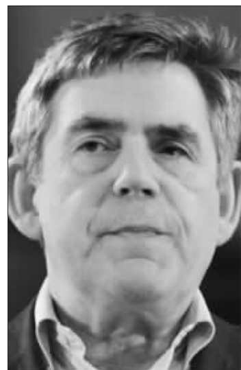
布朗首相是个火爆脾气?

据英国《每日邮报》1月31日报道,一本将于3月1日出版的新书爆料,称英国首相布朗曾多次在唐宁街10号动手打下属,还有一次在访问美国时破口大骂。随着英国大选在即,工党成员担心这些内容会损害首相的个人形象,从而打击工党的选情。