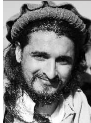
哈基穆拉·马哈苏德(资料图片)

巴基斯坦媒体1月31日爆出惊人消息,称该国塔利班武装头目哈基穆拉·马哈苏德在美军日前发动的一次空袭中受重伤而死。巴军方表示正在调查这则报道的真实性。美国媒体分析说,如果消息属实这对巴基斯坦和美国来说都是反恐战争的巨大胜利。