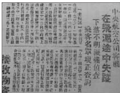
《中央日报》刊登的这次飞机失事的新闻

1946年12月14日下午四时许,浙江长兴县李家乡龙华庙的乡亲们,被一声巨响吸引出家门,他们看到了一幅平生从未见过的景象:龙华庙后的弄山上漫山遍野飞舞着崭新的钞票,蔚为壮观。贫穷了一辈子的乡亲们望着密集的“钞票雨”,不知所措了一会儿,立即呼号起来,倾巢而出,直奔弄山。所有人都在抢拾天上掉下的“馅饼”,这些钞票是从哪里来的,那声巨响到底是怎么回事?他们并不知道。更不知道的是,一个半小时之前,中央航空公司上海总部陷入了一片恐慌之中。