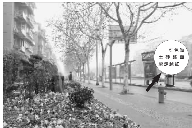
集庆门大街铺上“红地毯”, 用上“聪明灯”

沿街楼宇气色温暖宁静, 门头门面缤纷明亮, 围墙流光溢彩……继水西门大街后, 集庆门大街建成建邺区的第二条景观大道。人夜之后, 这两条景观路更是犹如两条闪光彩练, 与新开的万达广场形成了“二龙戏珠”的亮化格局。 昨天, 记者从建邺区了解到, 目前, 全长约2.98公里的集庆门大街改造工程已基本完成, 进入最后扫尾阶段。