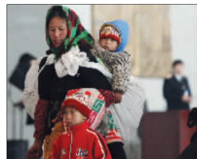
看好孩子,路上小心