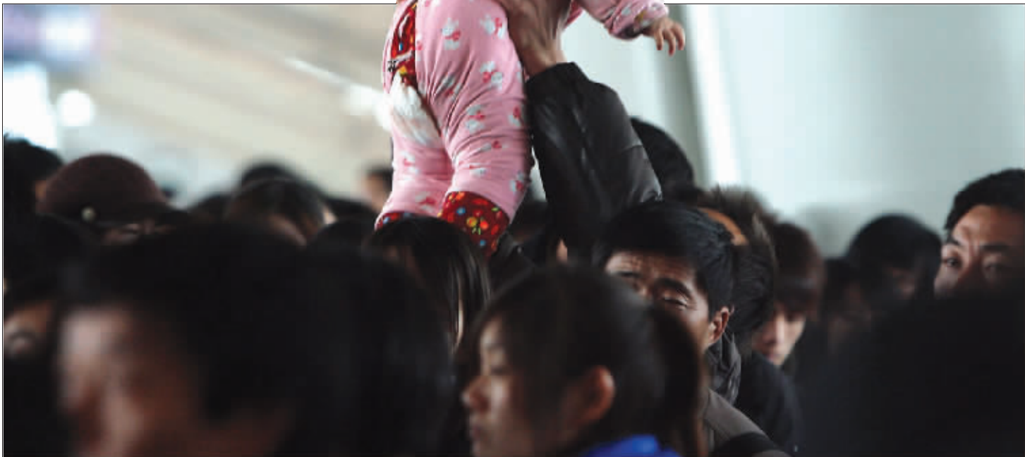
拥挤的购票大军中,一个男子将他的宝贝高举过头顶