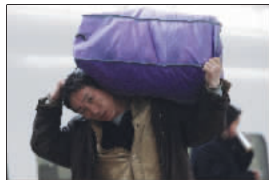
辛苦了一年,可以回家了