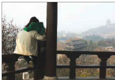
如今,八字山成为市民休憩游玩的休闲场所