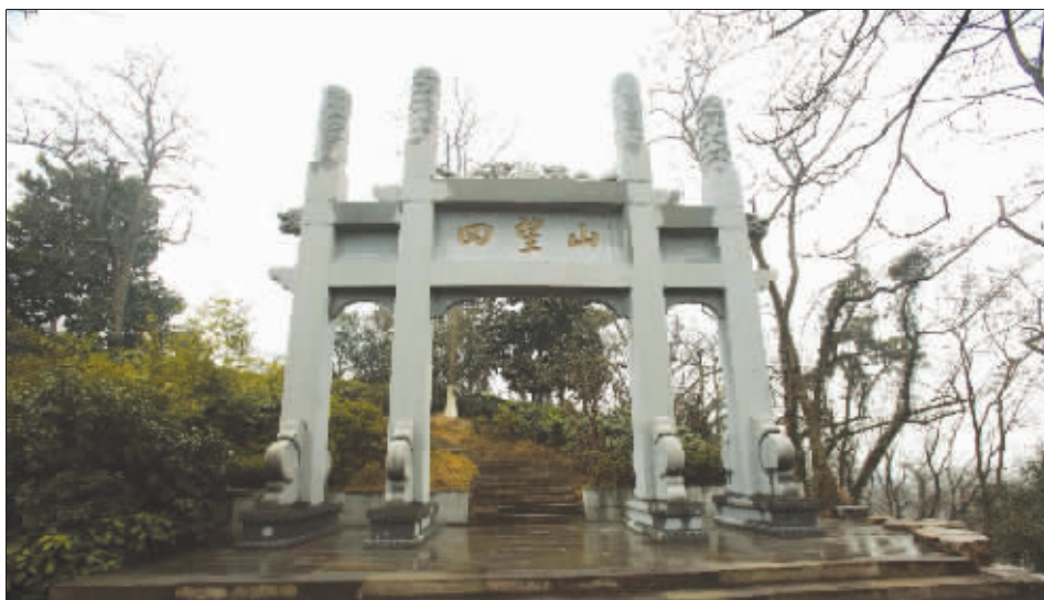
古时,这里名唤“四望山”;近百年,“八字山”更深入人心