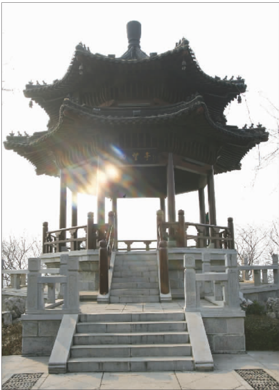
站定“四望亭”极目四望,远处景观被几幢老式楼盘遮蔽