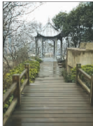
此山拥有43米小身段,极易行走,并不打算为难行者