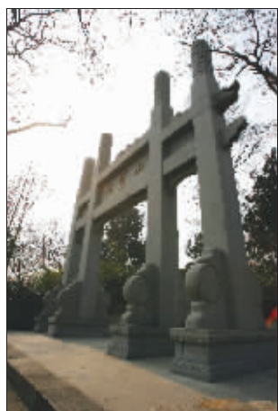
山不在高,有仙则名。孙吴所建石头城便基于此地