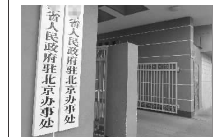
某省驻北京办事处

一位要求匿名的县级驻京办官员向快报记者讲述了他在北京的接访生活。面对“零上访”、“一票否决”等考核压力,地方政府不得不千方百计控制进京上访人员,花钱买“稳定”成为一些地方政府的“非常之举”。“这实在是不得已而为之。”他叹口气说。