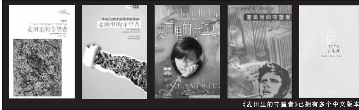
《麦田里的守望者》已拥有多个中文版本