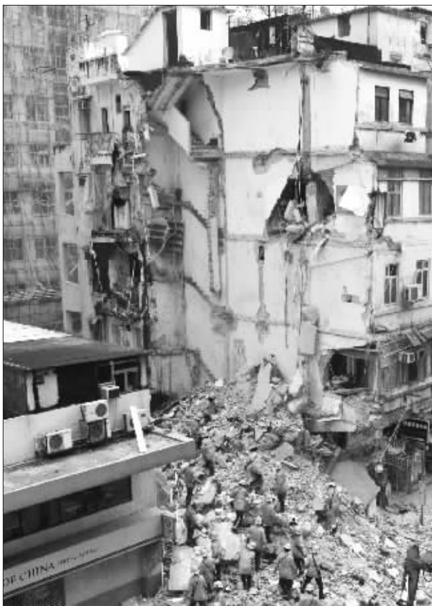
救援人员在现场寻找被困者