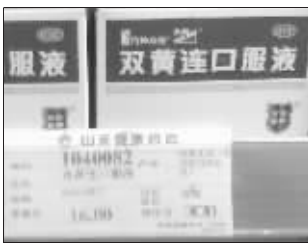
松寿堂药店双黄连口服液零售价

之后,记者又分别在南禅寺的市民大药房和山禾集团健康连锁药房看到,上述规格的“竹林众生”牌双黄连口服液价格均为6.5元一盒。记者不禁有些奇怪,同样是无锡市,同一家品牌的药店里,价格竟然相差了近10元。随后,记者联系了山禾集团健康参药连锁有限公司的一位负责人。据该负责人介绍,山禾集团药连锁店在无锡市有70多家分店,每一个分店的药