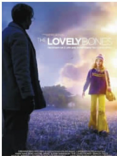
小红帽的故事不是神话