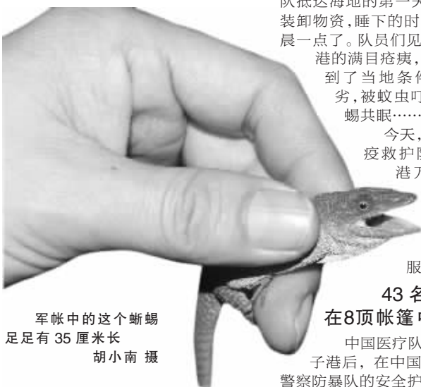
军帐中的这个蜥蜴足足有35厘米长