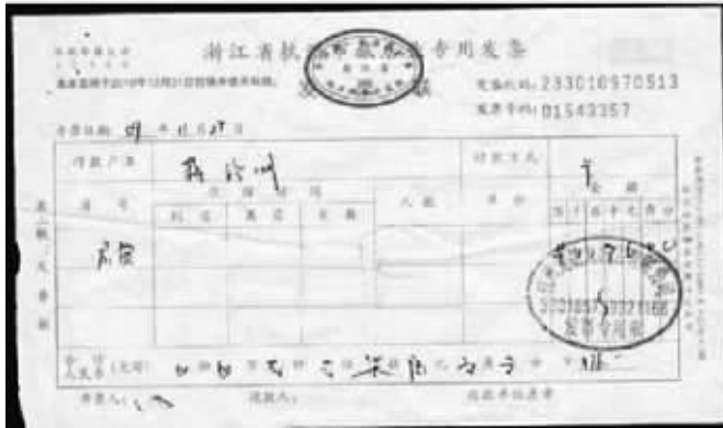
浙江省龙禧大酒店发票