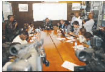
埃航召开新闻发布会(上图为埃航总部)

埃塞俄比亚航空公司(以下简称“埃航”)是埃塞俄比亚政府100%拥有的国营航空公司,负责经营多条定期客运和货运航线,也提供包机服务。埃航班机可前往全球45个目的地,并拥有庞大的国内航线网络。