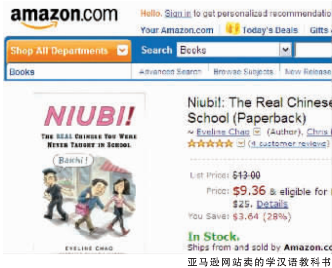
亚马逊网站卖的学汉语教科书

跟网友们小时候学的英语教科书差不多,这本书也是图文并茂的形式。上来第一张图片,就把网友们雷到了。在一个游泳池边,两个男孩对话,内容用拼音标注,一个说:“你看那个辣妹!”另一