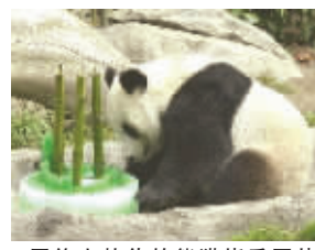
网络上热传的熊猫烧香图片

熊猫烧香的病毒肆虐大家是见识过了,日前,网络上热传一张正版熊猫烧香图片。乍一看,还真像熊猫在烧香,不过可以肯定,这是网友恶搞的。网友“□□”说,“这个绝对是正版熊猫烧香。”网友“河蟹愚乐”戏说,“熊猫烧香作者李俊:我是无辜的,它才是元凶……”