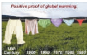
内裤百年演变图片

日前,网络上一组名为《内裤百年进化史》的图片热传,也引起网友的激烈争议。该组图片是18世纪至今各个不同时段的内裤对比,对比发现,从18世纪开始,内裤的面积越来越小,由原来的长裤型内裤演变成当前的丁字型内裤,这说明了什么?