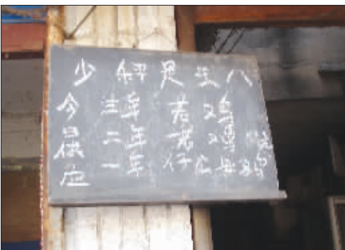
▲诚信 做生意,讲的就是诚信,瞧人家这位老板,“少秤是王八”,你还不相信人家吗?(作者将获30元话费)