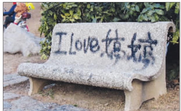
▲爱?唉! 爱一个人没错,把爱写在公园的椅子上,就是你的不对了。 (作者将获30元话费)