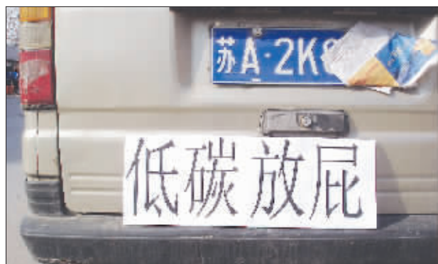
▲低碳放屁 现在全球都流行低碳生活,可这位老兄,在自己的面包车上贴了一个“低碳放屁”,真是让人无语。 (作者将获30元话费)