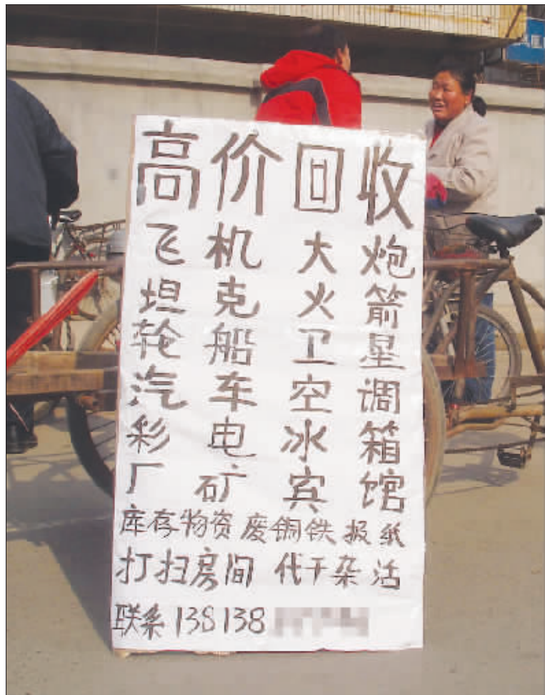
▲回收 飞机大炮统统回收,请问,收了您放哪?(作者将获30元话费)