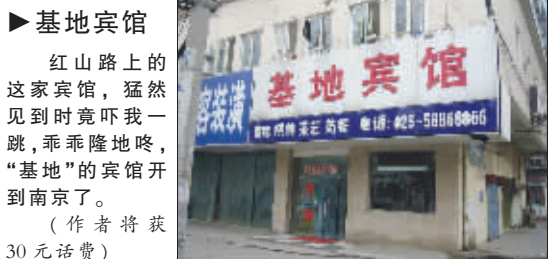
►基地宾馆 红山路上的这家宾馆,猛然见到时竟吓我一跳,乖乖隆地咚,“基地”的宾馆开到南京了。 (作者将获30元话费)