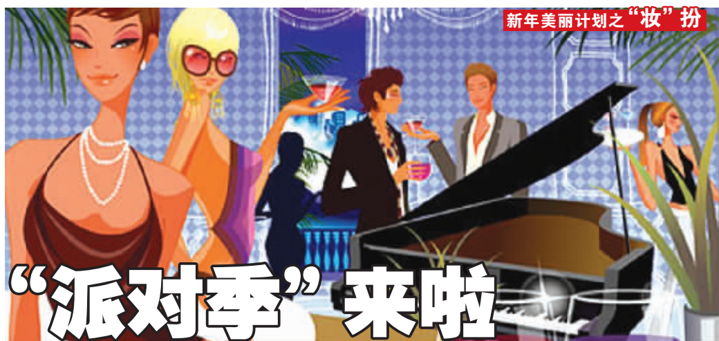
新年美丽计划之“妆”扮