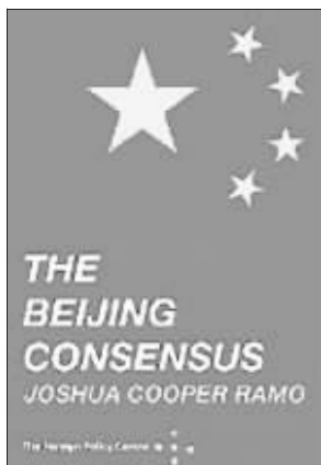
美国人乔舒亚·库珀·雷默发表的题为《北京共识》的论文,炒热了所谓的“中国模式”。

文章称,美国国家经济委员会主任萨默斯称“美国已不再是世界的火车头”,有意让出主角的位置。然而,这只是美国捧