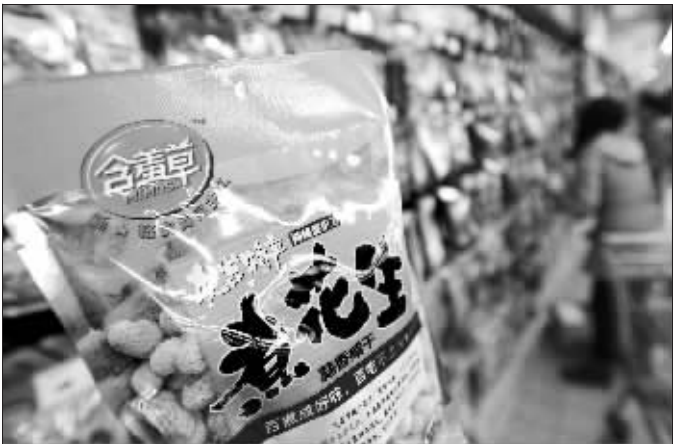
超市货架上的含羞草食品

子就得停产。”现场一名工人望着火苗直窜的大楼称,他原本在三楼上班的,幸好当天里面工人很少。该工人称,按照常规,三楼加工间也应该有几个人,一楼和二楼都应该有值班的,上午发生火