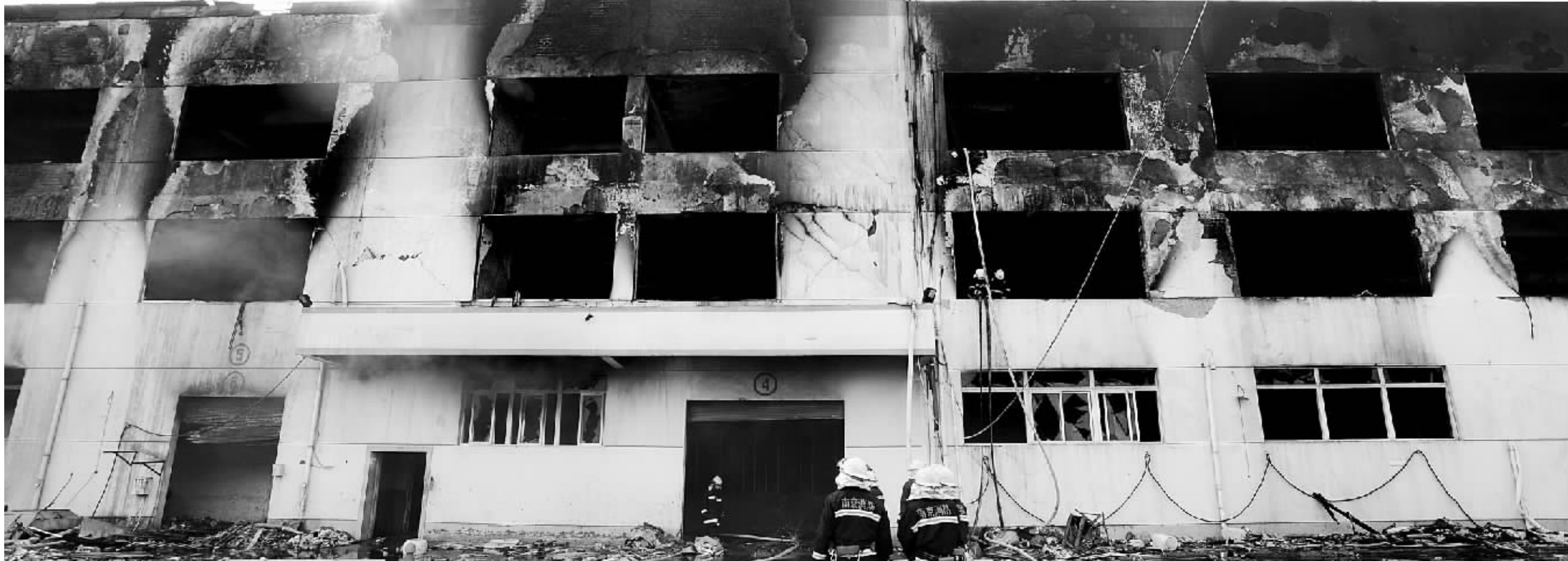
三层楼烧成了空壳,损失预计超千万