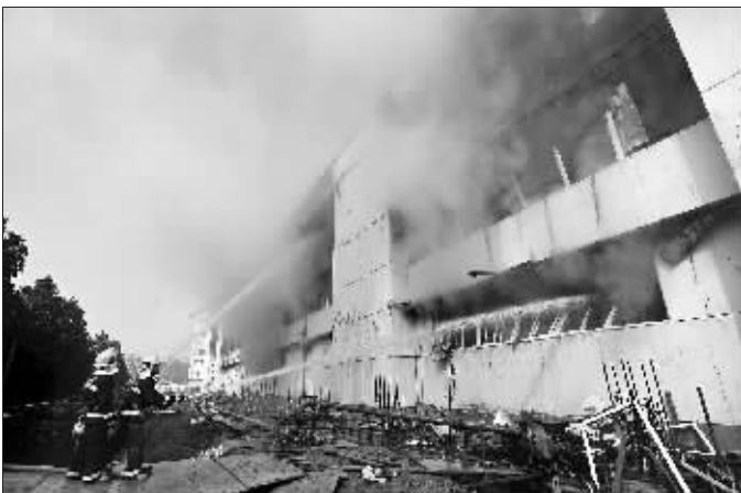
火势太大,喷水的效果有限