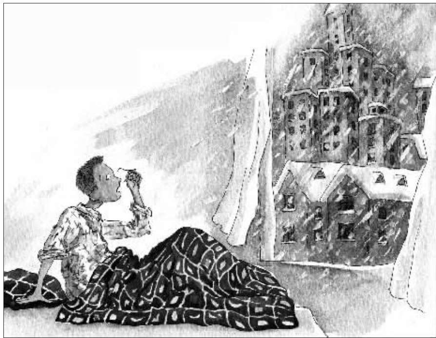
绘图/鲁嘉 插画师 美国SND插图奖获得者 已婚

早晨起来,窗外飘起了雪花,我一点兴致也没有,天气预报咋这么不准啊!前天说,明天天冷,咱赶紧换件厚衣服,你猜咋的?浑身冒汗,那个热啊!昨天说,今天天热,咱赶紧换件薄衣服,结果浑身鸡皮疙瘩。