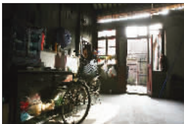
老宅内部有很多木质结构