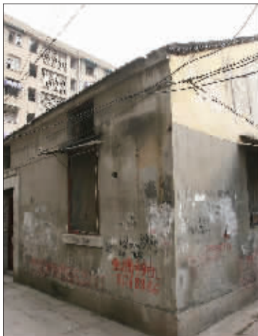
热河路103巷的老宅即将拆迁