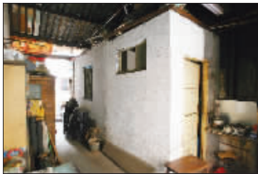
岁月已让老宅变得残破不堪