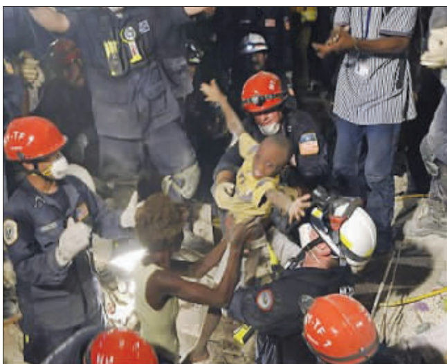
吉吉获救后,喜悦地张开双臂要抱妈妈