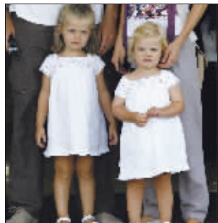
左边女孩是莱昂诺尔公主

不管00后是不是在时代背景下、社会的优越下被宠坏了,他们这一代肯定代表着未来与希望。而西方王室中也成长起了一批00后,挪威的英格丽德·亚历山德拉公主1月21日年满6周岁,西班牙的莱昂诺尔公主和丹麦的克里斯汀王子都才4岁多,他们都衔着金钥匙出身,现代化的科技、古老的传统包围着他们,更别提,他们中的好些还是将来的王位继承人。老天对他们格外优待,还给了他们好皮相,时光在他们身上始终仁慈地刻画着可爱与帅气,只能说,希望他们在女(男)大十八变的同时,能始终发挥优良风格,千万不要像英国的威廉王子,好好的80后硬是长成了发线靠后的大叔样。