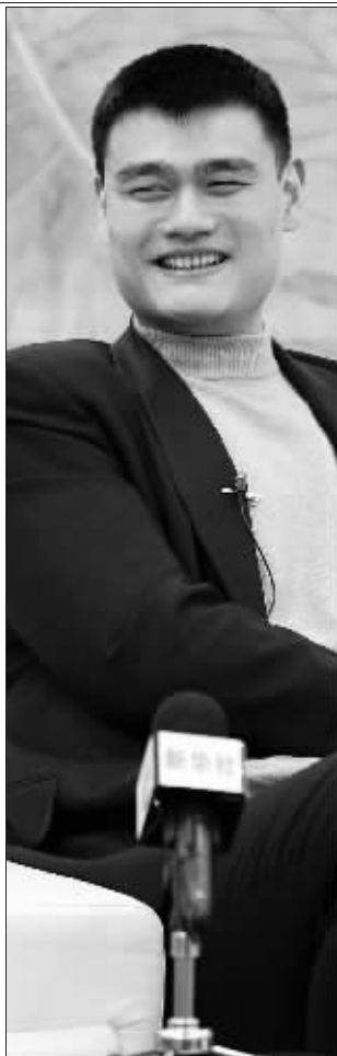
姚明确接受采访笑脸盈盈