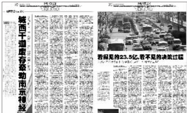
▼▲快报周刊去年 5 月 10 日的相关报道引起广泛关注。