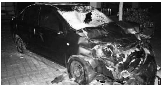
1.“雪佛兰”车头撞得破烂不堪 2.受伤学生张彬的妈妈痛哭不已