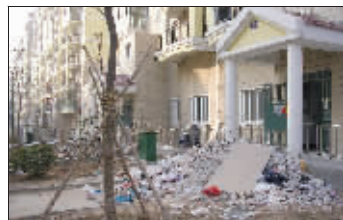
单元门入口也被垃圾堵住

门口堆满,后来物业才派人清理。在另一幢楼下,化粪池满溢,熏得业主不敢开窗。无奈,业主只好在地面挖了个坑,将溢出的粪便引流过去。“这只是临时的办法,坑很快就会满”。