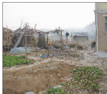
小区围墙缺口连缺口

走近北出口,先闻到一股大粪的臭味。原来这里搭建了一个临时厕所,供建筑工人使用,里面的粪便已多日没有清理。北出口没有建大门,也看不到门卫。