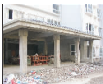
会所门前堆满垃圾

之间,看不到绿化和建好的道路,只有高高的土坡,上面长满杂草。“这下面是施工时留下的土方,应该拖走的,但一直留在这里。”业主站在土坡上,自嘲地哼着歌,“我站在高岗上,往下望……”他突然停住,“我们这可是山景房啊。”