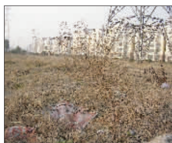
规划中的绿地如今杂草丛生

“车库现在是地下暗河。有车的业主,汽车只能停在地面上——要知道,最早的可是2006年12月就入住了。”采访中,有人气愤地对记者说。