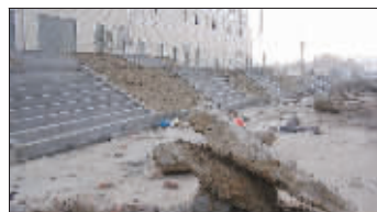
台阶陡,渣土堆满路

马路对面是另一个小区。门面房已经开始营业,一派繁荣景象。“人家建得比我们迟,弄得比我们好。”业主们看着对面漂亮的高楼,脸上满是羡慕。