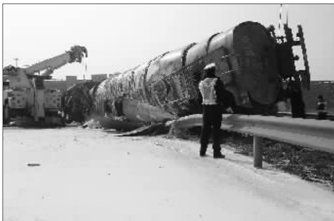
路面上洒满了硫磺

昨天上午10点左右, 一辆载重30吨的槽罐车驶出二桥高速葛塘出口, 槽罐上印着“危险品”字样。当它绕过弯弯的匝道正要进入宁六公路时, 前面一辆汽车突然急停。体形庞大的槽罐车刹车不及, 撞上左边的防护栏, 向左侧翻在路口。黄色的液体从破裂的槽罐流出, 冒出淡淡的白烟, 空气中弥漫着一股臭味。“危险品泄漏啦!” 路过的其他车辆驾驶员大呼。