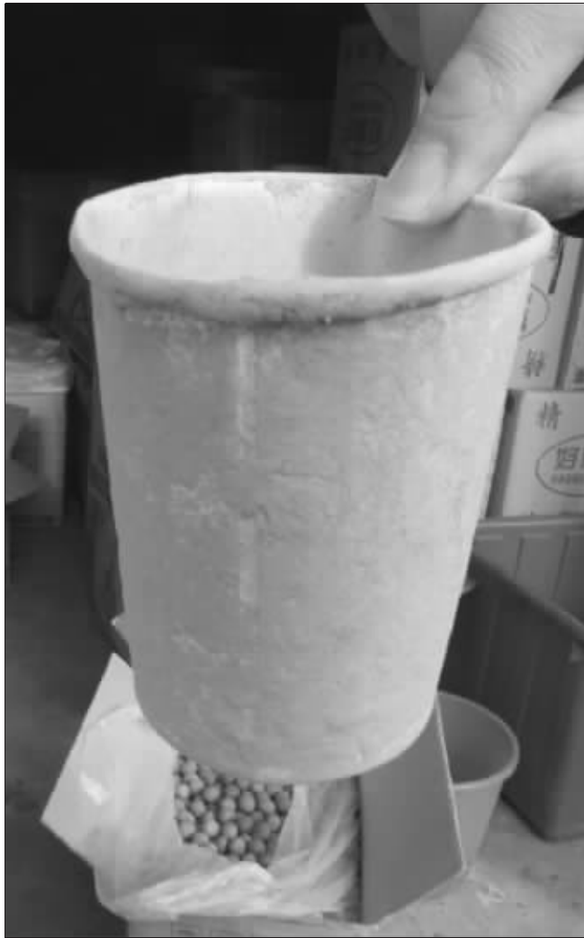
记者在桂圆加工点发现的沾有黄色粉末的纸杯

干桂圆放于一特制容器里,加入少量当地的河沙,再倒入一定量的水,然后反复摇荡,使其表面互相摩擦,将干桂圆的粗糙表皮磨掉。处理后的桂圆干烤出来颜色金黄,要比未处理的漂亮得多。