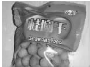
记者买到的现场封装的桂圆干