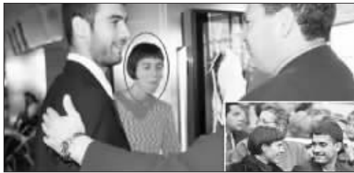
瓜迪奥拉的妻子很少亮相