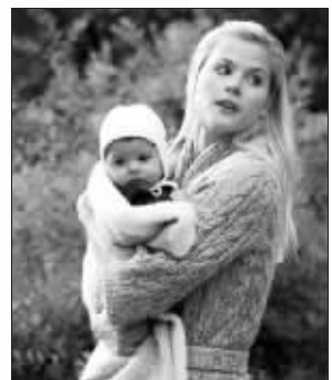
对于伍兹的各种传闻,“虎太太”艾琳一点都不关心。

傅博士同时表示,“性欲亢进症”患者有的有精神障碍,有的则无精神疾病,但具有潜意识心理障碍。“这一类人通常社会功能完好,而且有此症状也并不对他人、社会造成影响或破坏。如果伍兹果真患有这个病的话,应该属于这一范畴。对他来说,最多在社会道德层面受到批评,是否去接受治疗要看他个人的意愿。”