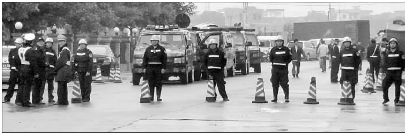
2009年12月30日,广东调动14辆装甲车和近500警力围剿了这个号称东莞最大的地下赌场