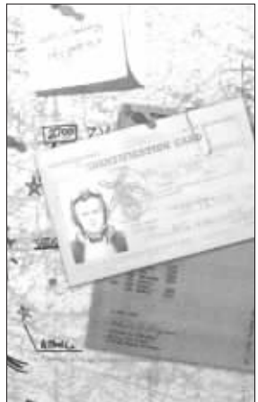
这款游戏中还有鲁尼的身影?

当年,巴西球员罗纳尔多跟随西班牙皇家马德里俱乐部访华后不久,电视上就不断地出现罗纳尔多拿着金嗓子喉宝的广告,当时还有人议论,金嗓子集团竟然能请到罗纳尔多代言很厉害。然而到了2007年,罗纳尔多的经纪人突然表示,他们正在搜集相关证据,要状告金嗓子集团侵犯了罗纳尔多的肖像权。直到此时,人们才知道,原来肥罗并没有和金嗓子喉宝签订过任何广告合同,也没有为他们拍摄过类似的广告。而根据其经纪人的说法,当时罗纳尔多只是在和该集团老板吃饭时拿着他们的产品拍了张照片,却没想到变成了那个广告。