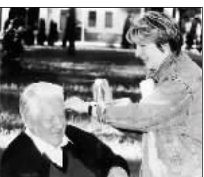
1996 年自感“有点肥”的塔季扬娜和父亲叶利钦在一起