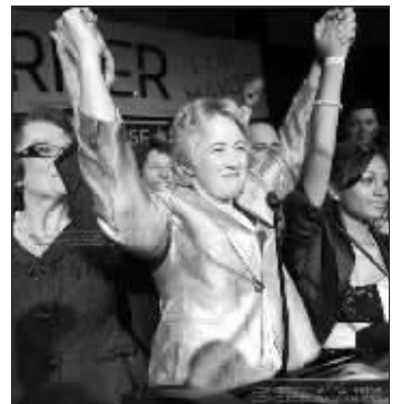
安妮丝·帕克不久前赢得了美国芝加哥市长选举

去年 2 月 1 日,西于尔扎多蒂当选冰岛总理,成为世界首个公开同性恋身份的政府首脑,这是同性恋者在世界政治史上一个里程碑式的事件。西方人民真的能坦然接受同性恋政治人物?公开同志身份对于政客来说是个利大于弊的举措吗?