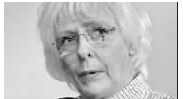
冰岛总理西于尔扎多蒂