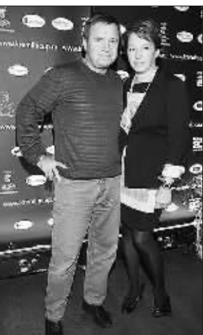
2009 年 12 月身材苗条的塔季扬娜和丈夫瓦伦汀在一起

据英国《每日邮报》《每日快报》12 日报道,俄罗斯前总统叶利钦的小女儿塔季扬娜·尤马舍娃日前在她的博客上披露了一度曾在克里姆林宫内流行的“减肥怪招”:想要加入减肥队伍的克里姆林宫官员和职员一起签署“减肥合同”,如果谁没有在规定时间内减肥成功,那么他们将被迫受到“减肥合同”中指定的羞辱性惩罚,这些惩罚包括被迫卖掉自己心爱的名车、辞掉薪水丰厚的工作或天天穿着晚礼服到政府办公室上班等。塔季扬娜本人通过这一克里姆林宫“减肥怪招”,成功地让自己减掉了 10 公斤的体重!