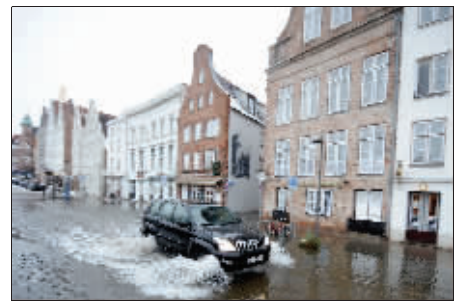
德国北部河流决堤导致洪水