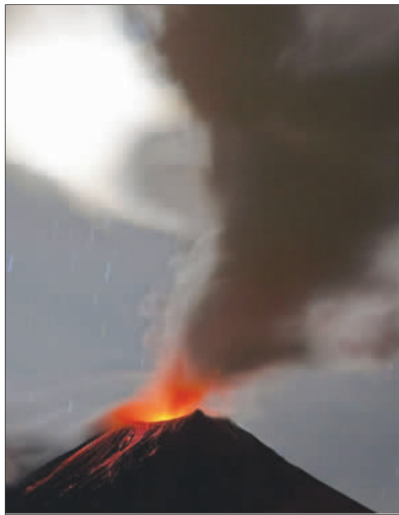
厄瓜多尔通古拉瓦火山喷出岩浆和火山灰。