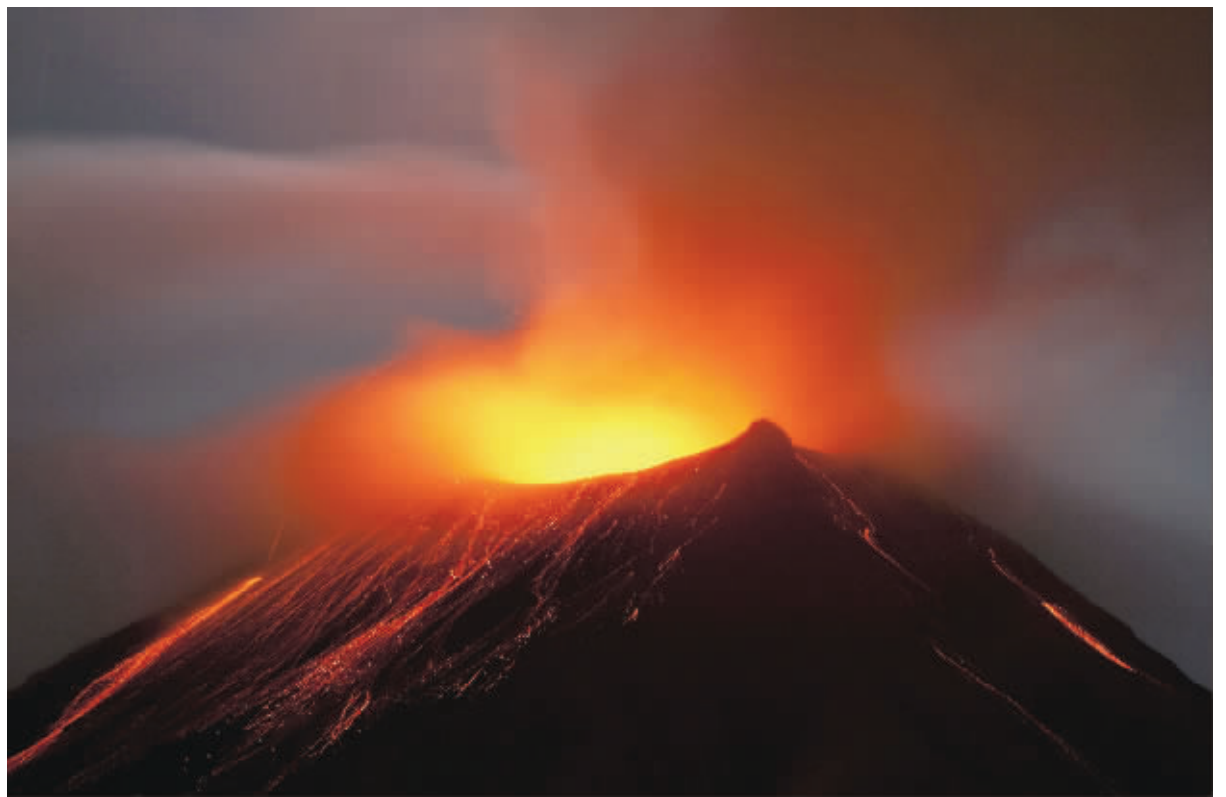
通古拉瓦火山是厄瓜多尔活动最频繁、危险性最大的火山之一。图为11日厄瓜多尔通古拉瓦火山喷出岩浆和火山灰。