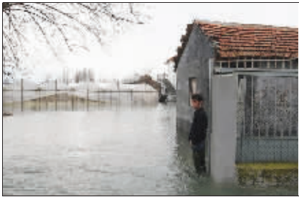
阿尔巴尼亚的洪水 网易