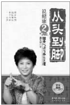
曲黎敏 著 长江文艺出版社友情推荐

第三,肺司呼吸,肺统管人的呼吸。一个人如果呼吸顺畅的话,心情就很愉悦。假如连起码的呼吸都不顺畅了,根本就谈不上有好的生活质量。比如现在很多人有胸闷气喘的毛病,动不动就得叹口气,这就是膈肌的运动能力变弱的表现;而哮喘就更是肾不纳气的表现了。