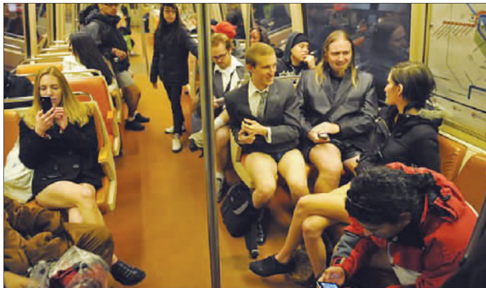
地铁“不穿裤子”,很多人响应

麦兜曾经问:“扮那些社会栋梁,要不要穿裤子?”有人回答说:“当然要了,哪有社会栋梁不穿裤子的?”