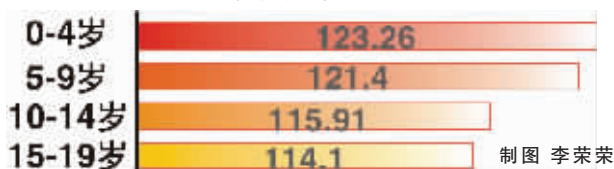
社科院发布的去年中国人口性别比