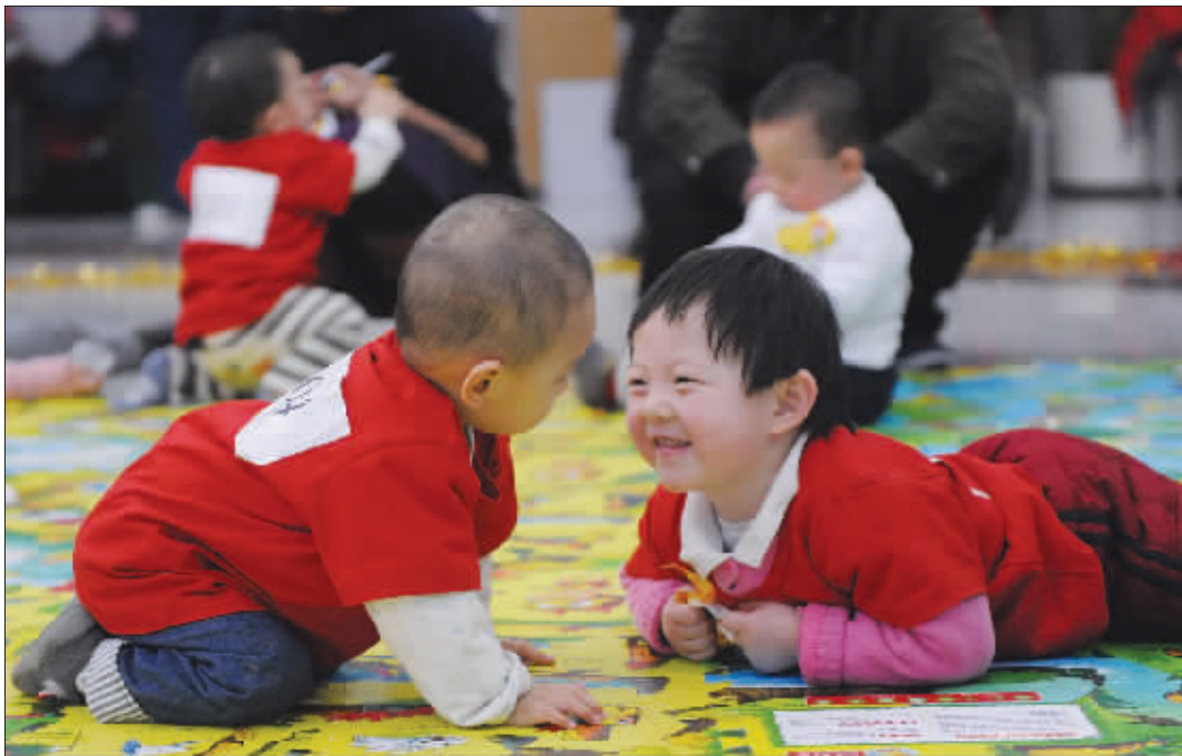
到2020年,我国可婚男性将过剩2400万。 IC

专家告诉记者,在我国,还有一些具体的原因,比如B超泛滥。“无论是三维还是四维,哪怕是最普通的B超,在胎儿四个月的时候就可以鉴别出性别来。”专家说,在重男轻女思想的作祟下,人们违法进行性别鉴定,然后有选择进行引产,是导致男宝宝偏多的一个重要原因,这个现象在农、郊比较常见。而另一个重要原因就是“二胎”,蔡满红说,有儿子的人,大多不会选择二胎,而生女儿的人,如果经济条件允许,现在不少都有这个想法。