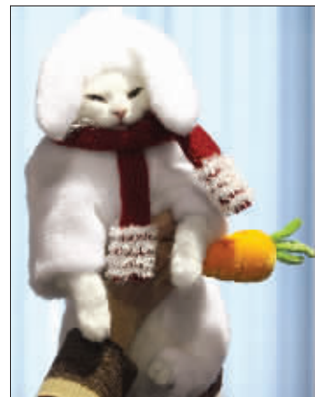
1月10日,在俄罗斯克拉斯诺亚尔斯克,一只土耳其安哥拉猫打扮成兔子的形象亮相。