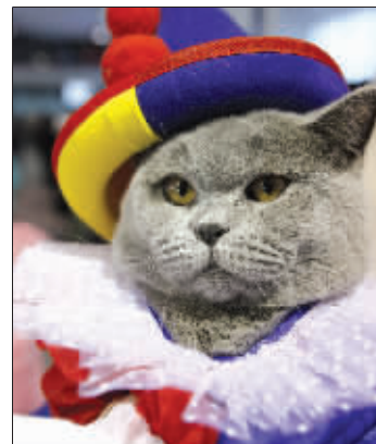
一只短毛猫穿着小丑服装亮相。